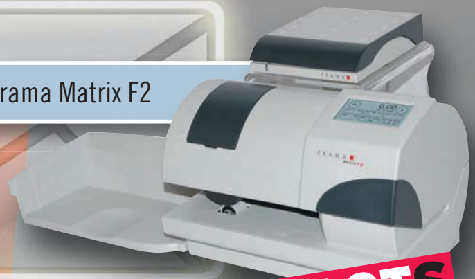
Frama Matrix F2

Nur Anbieter, die bei der Transparenz des Angebots und beim Service allerbeste Leistungen zeigen, erhalten das FACTS-Urteil „sehr gut“.